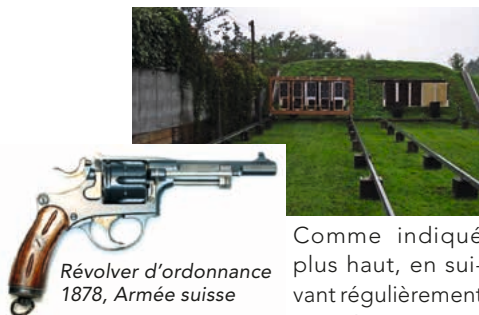
Régolver d'ordonnance 1878, Armée suisse

Chaque année, le comité vous permet également de pouvoir essayer une arme historique ou particulière. Cette année, nos tireurs peuvent se mesurer entre eux avec le revolver d'ordonnance de 1878 à travers notre concours interne.