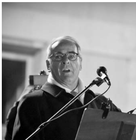
Monsieur Adolf OGI, ancien Président de la Confédération