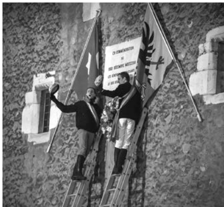
Zofingiens venant d'accrocher la couronne commémorative et proclamant « Vivat, Crescat, Floreat Tobinia ad aeternam! »

1911, la Chancellerie d'Etat illumina la Treille à l'aide de feux de Bengale. Depuis plus de 40 ans, les descendants de la garde nationale de Genève sont associés à cette cérémonie. Un grand merci à vous les Vieux Grenadiers et à votre commandant.