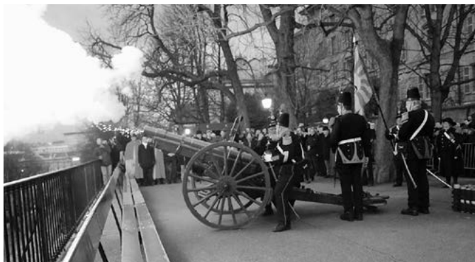
Traditionnel tir d'artillerie opéré pour commémorer la Restauration le matin du 31 décembre 2014 par la pièce de la Treille servie par une équipe de pièce issue du Groupe de Vieux Artilleurs de la Société d'artillerie de Genève.